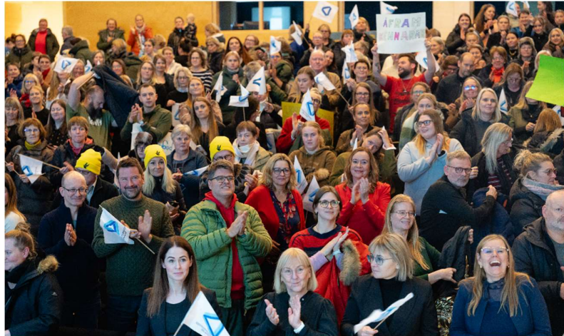
Af samstöðufundi á Akureyri

Í stað þess að lýsa hér í allt of löngu máli því ferðalagi sem hófst að hausti 2024 og lauk svo þann 25. febrúar