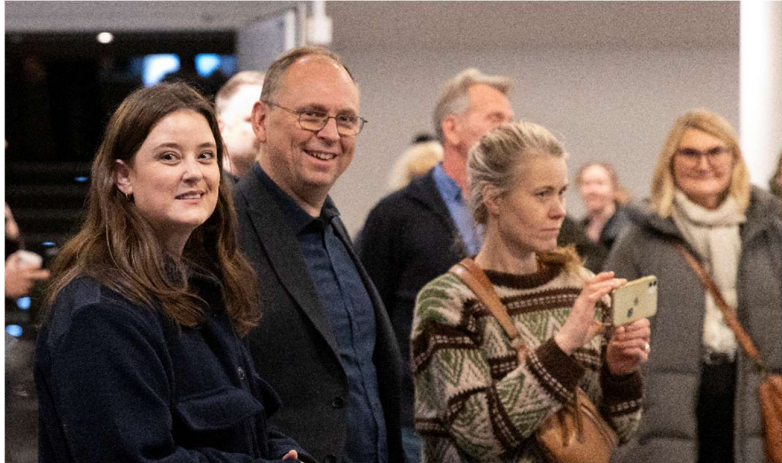
Formaður FF í anddyri Háskólabíós við upphaf samstöðufundar í nóvember 2024

Á aðalfundi þann 14. október 2022 var stefna félagsins í kjaramálum og kjarasamningum fyrir árin 2022 til 2026 samþykkt. Tillaga um kjarastefnuna hafði verið unnin í samstarfi stjórnar, samninganefndar og skólamálanefndar þetta haustið og fram að aðalfundi. Megináherslan var lögð á að ná fram jöfnun launa milli markaða og hóf félagið strax undirbúning að erindreksri í öllum framhaldsskólum með að markmiði að kynna áherslur FF.